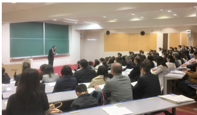
※写真はメディアホールで開催のセミナーイメージです。